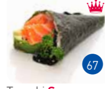
Temaki Saumon Avocat (1p)