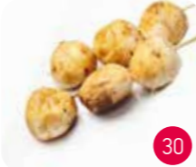
Brochettes Champignon (2p)