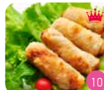
Nems Poulet (3p)