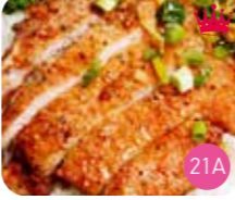
Poulet Grillé (env.6p)