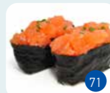
Tartare Saumon (2p)