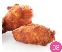
Wings Poulet (2p)