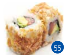
Croustillant* Saumon Avocat (6p)