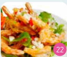
Crevette Sel et Poivre Pimenté (6p)