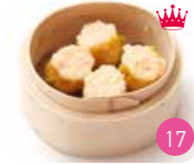
Bouchées Crevette (3p)