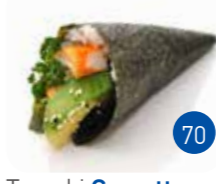
Temaki Crevette Avocat (1p)