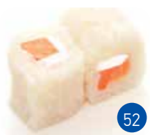
Neige Saumon Fromage (6p)