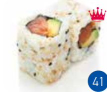
California Saumon Avocat (6p)