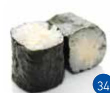
Maki Fromage (6p)