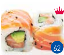
Las Vegas Saumon Avocat (6p)