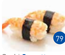
Sushi Crevette (2p)