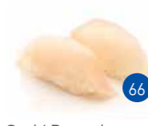
Sushi Daurade (2p)