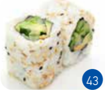
California Concombre Avocat (6p)