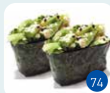
Tartare Avocat (2p)