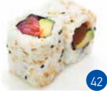
California Thon Avocat (6p)