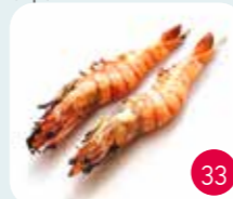
Brochettes Gambas (2p)