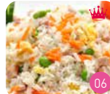
Riz cantonnais (sans Porc)