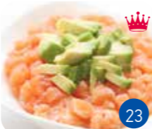
Chirashi Tartare Saumon Avocat sur Bol Riz Vinaigré