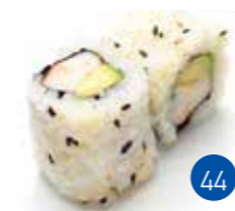
California Surimi Avocat (6p)