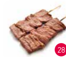
Brochettes Bœuf (2p)