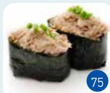
Tartare Thon Cuit (2p)