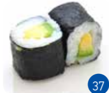
Maki Avocat (6p)