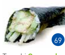
Temaki Concombre Avocat (1p)