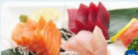
Sashimi Servi Une Seule Fois au Choix (5p) • Saumon • Thon • Daurade