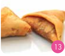
Samoussa Bœuf (2p)