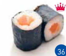
Maki Saumon (6p)