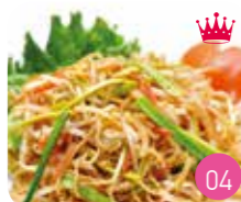
Nouilles Sautées Nature