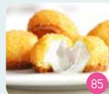
Beignets Fromage (4p)