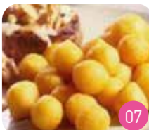
Pomme de Terre Noisette (4p)