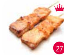
Brochettes Saumon (2p)