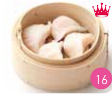
Raviolis Crevette (3p)