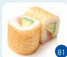
Maki Soja Saumon Avocat (6p)