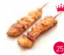
Brochettes Cuisse De Poulet Sans Os (2p)