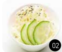
Salade de Choux