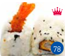
California Tempura (6p)