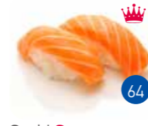
Sushi Saumon (2p)