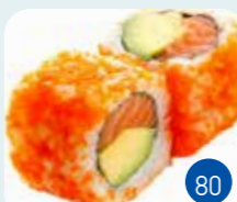
Tobiko** Saumon Avocat (6p)