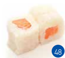
Neige Saumon (6p)