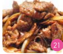
Bœuf aux Oignons (env.6p)