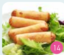
Nems Crevette (3p)