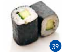
Maki Concombre (6p)