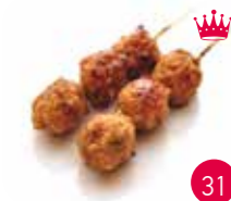
Brochettes Boulette De Poulet (2p)