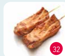
Brochettes Thon (2p)