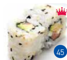
California Saumon Avocat Fromage (6p)