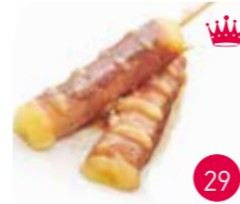
Brochettes Bœuf au Fromage (2p)