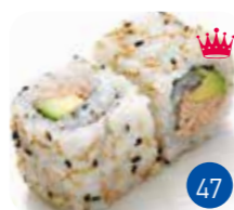
California Thon Cuit Avocat (6p)