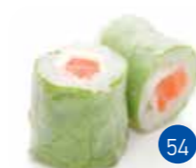
Printemps Saumon Fromage (6p)