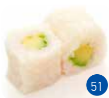
Neige Avocat (6p)