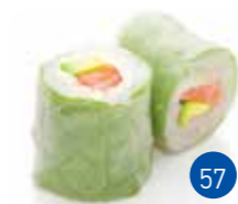
Printemps Saumon Avocat (6p)