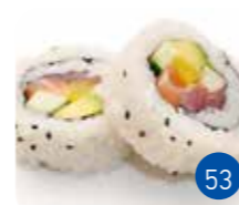
FutoMaki Mix Ingrédient (2p)