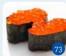
Tartare Œufs de Saumon (2p)