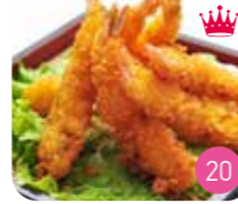
Tempura Crevette (3p)