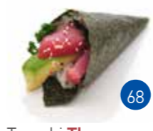
Temaki Thon Avocat (1p)