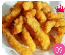
Beignet Poulet (env.4p)