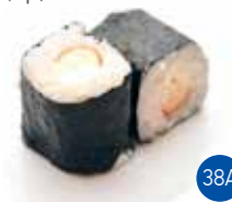
Maki Crevette (6p)