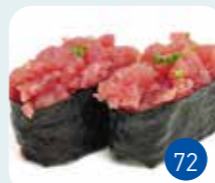
Tartare Thon (2p)