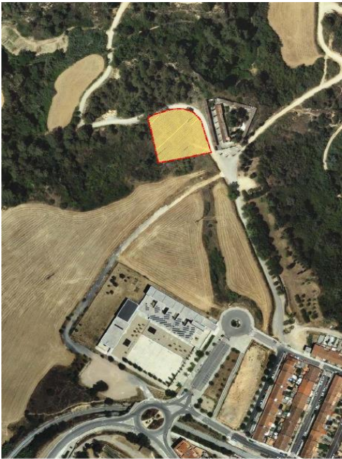
CONVENI URBANÍSTIC FITXA 2