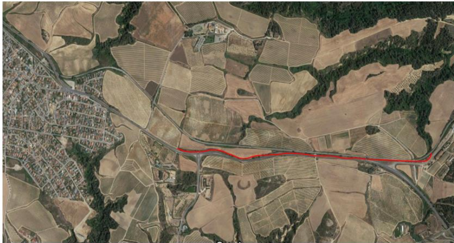
CONVENI URBANÍSTIC FITXA 4