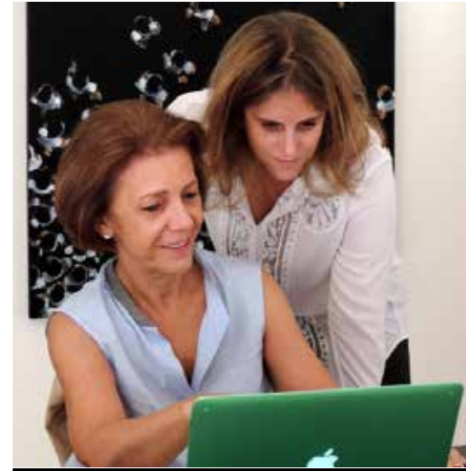
Raya et sa mère.