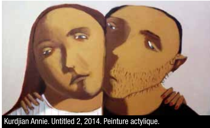
Kurdjian Annie. Untitled 2, 2014. Peinture acrylique.