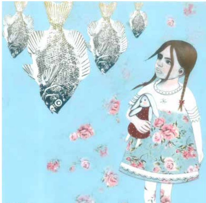
Saba Soleymani. Untitled 14. Travaux sur papier.

L'art au Moyen-Orient a désormais une vitrine de choix. Artscoops.com est une plateforme en ligne d'art contemporain qui met en lumière des artistes du Moyen-Orient.