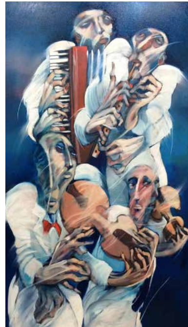
Saad Yagan. Band. Huile sur toile.

L'art au Moyen-Orient a désormais une vitrine de choix. Artscoops.com est une plateforme en ligne d'art contemporain qui met en lumière des artistes du Moyen-Orient.