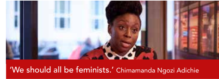
'We should all be feminists.' Chimamanda Ngozi Adichie

februari 2016 Debatten met De Nieuwe Liefde In 2016 organiseren Atria en De Nieuwe Liefde een serie debatten. Zo komen er in februari 2016 270 bezoekers naar het debat M/V: Hokjesdenken in de liefde .