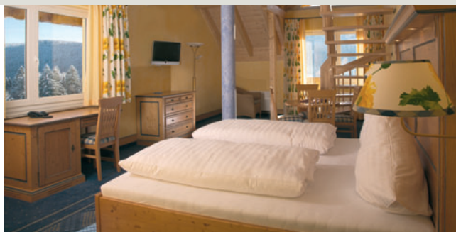
links: Das Hotel Sankt Florian am Titisee wurde umfassend saniert und erweitert. rechts: Insbesondere für Familien eignen sich die attraktiven Maisonnettezimmer über zwei Etagen mit innen liegender Treppe.