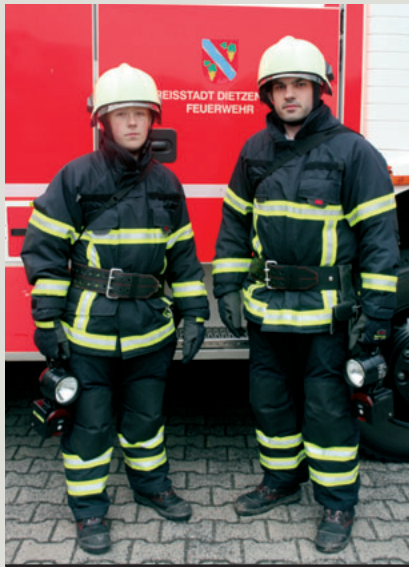
Geprüfte und zugelassene Persönliche Schutzausrüstung ist unabdingbar für die Sicherheit der Einsatzkräfte.

»Wir benötigen eine praktikable Lösung, bei der die Führungskräfte vor Ort – vor allem auf ehrenamtlicher Ebene – nicht mit zusätzlicher Arbeit durch Gefährdungsanalysen für Standardmaterial belastet werden«, resümiert Ziebs die Diskussion. Für