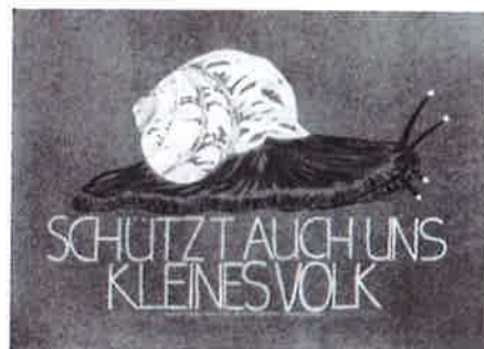
Naturschutz-Werbeplakat der Studienanstalt der Ursulinen, Berlin. 12 (1930) 1: 22