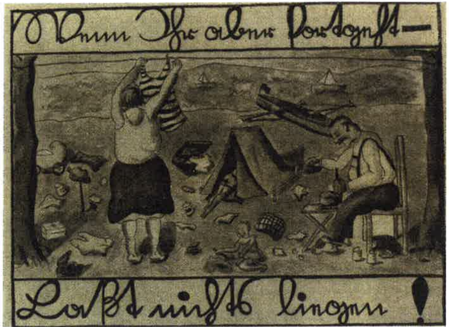
Naturschutz-Werbeplakat der Westend-Schule Berlin-Charlottenburg. 12 (1930) 1: 20 (Wenn Ihr aber fortgeht – Laßt nichts liegen!)

Seit es Menschen gibt, werden auch die Alten geklagt haben über die Unbotmäßigkeit der heranwachsenden Jugend. Es ist vielleicht Adam und Eva so ergangen. Jedoch kaum ein Geschlecht hat wohl mehr Grund zu klagen als das jetzt lebende. Es scheint fast, als hätten Schule, Kirche, Familie und alle Volksbil-