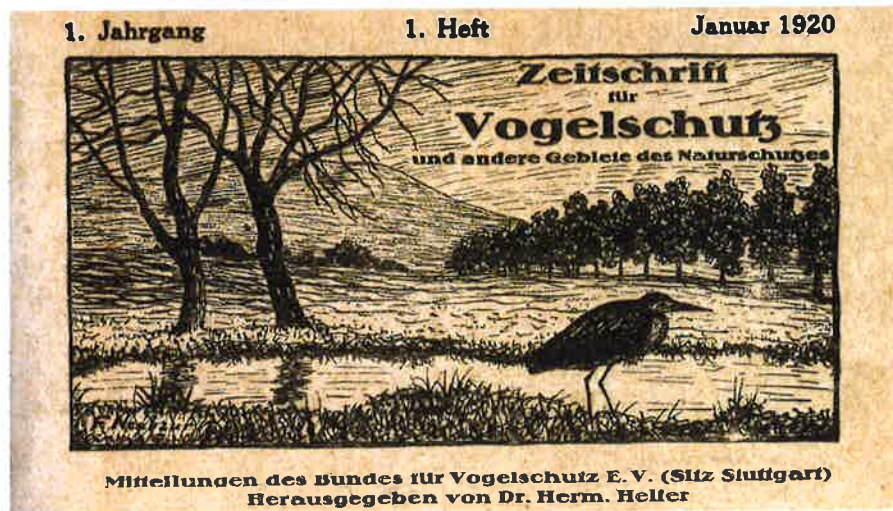
Kopf des ersten Heftes: Januar 1920

Titel und Ausrichtung unserer von Anfang an monatlich publizierten Zeitschrift haben sich in den Jahren der Weimarer Republik mehrfach geändert. Zu ihrer Gründung im Januar 1920 erschien sie als „Zeitschrift für Vogelschutz und andere Gebiete des Naturschutzes“. Im Vogelschutz lag zunächst auch der inhaltliche Schwerpunkt. Mit dem dritten Jahrgang von 1922 wurde der Fokus erweitert. Die Zeitschrift trug nun bis zum Ende des Zweiten Weltkriegs den Titel „Naturschutz“; von 1922–1924 mit dem Zusatz „Zeitschrift für Naturdenkmalpflege und verwandte Bestrebungen, insbesondere für Vogelschutz“, 1925–September 1927 mit dem Zusatz „Zeitschrift für das gesamte Gebiet des Naturschutzes, Naturdenkmalpflege und verwandte Bestrebungen“. In den ersten Jahren enthielt sie die „Mitteilungen des Bundes für Vogelschutz“. Ab 1922 waren ihr auch die „Mitteilungen aus der Staatlichen Stelle für Naturdenkmalpflege“ beigelegt.