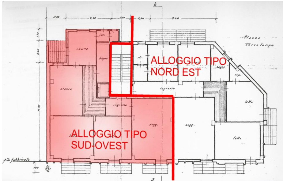
PLANIMETRIA CON EVIDENZIAZIONE DELL'INTERNO N. 11

Il ctu: Arch. Francesco CAPOZZOLO Studio tecnico via Napoli, 363/F – 70123 Bari Tel. 080.5347099 – Cell. 347.2424648 E mail-pec francesco.capozzolo@archiworldpec.it