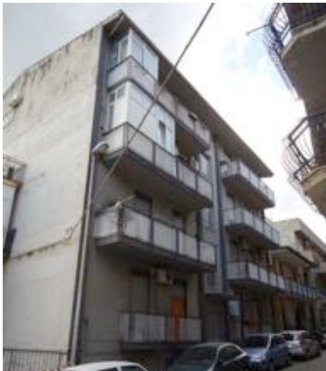
Vista dalla via Emiro Giafar

All'immobile si accede dal civico n. 7 della via A. Paternostro, attraverso un cancello in ferro carrabile (foto 3). L'immobile è raggiungibile anche dalla scala condominiale con accesso da civico n. 2 della retrostante via E. Giafar, attraverso un portone in alluminio anodizzato e vetro (foto 4). La scala condominiale presenta rivestimento in granito, ringhiera in ferro verniciato e pareti intonacate (foto 5). L'edificio, realizzato con struttura portante in c.a. e solai in latero-cemento, non è dotato di ascensore né servizio di portierato.