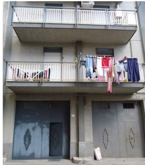
Vista dalla via Alessandro Paternostro