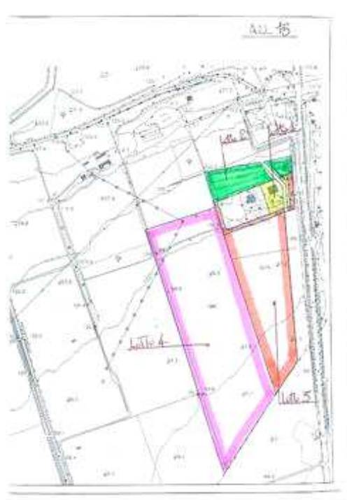
LOTTO ! - VILLA con terreno circostante

cantina , sviluppa una superficie commerciale di 148,35 Mq.