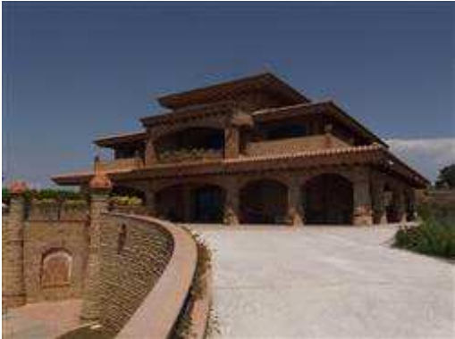
Prospetto principale villa

superstrada distante circa 5 km. da centro abitato