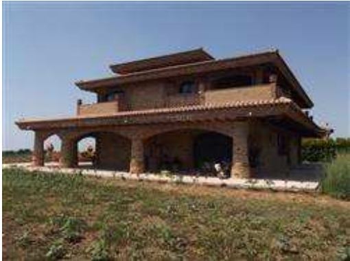
Prospetto principale villa

I beni sono ubicati in zona fuori dal centro abitato in un'area agricola, le zone limitrofe si trovano in un'area agricola. Il traffico nella zona è locale, i parcheggi sono inesistenti.