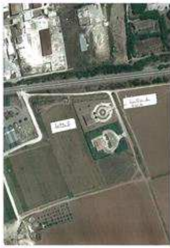
LOTTO ! - Villa con terreno circostante

I beni sono ubicati in zona fuori dal centro abitato in un'area agricola, le zone limitrofe si trovano in un'area agricola. Il traffico nella zona è locale, i parcheggi sono inesistenti.