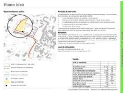
Stralcio scheda ATR2 - previsioni di trasformazione