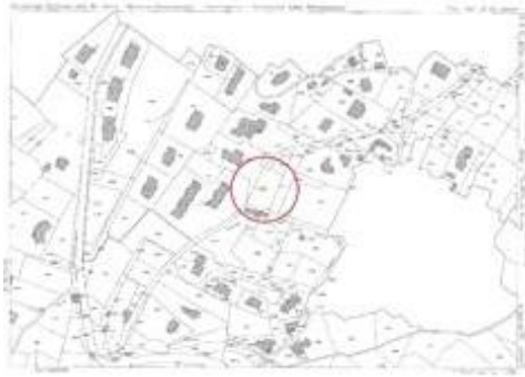
Estratto di mappa catastale