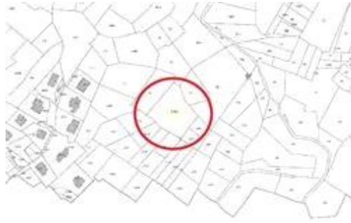
Stralcio estratto mappa catastale