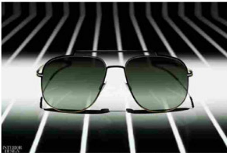
Avus sunglasses in bronze by Sebastian Herkner for icl Berlin.

"The difference is in the details—be it curve, radius, or proportion," says Sebastian Herkner on designing his first eyewear collection.