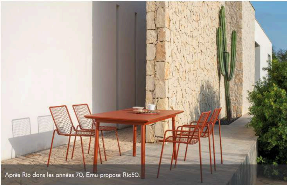
Après Rio dans les années 70, Emu propose Rio50.