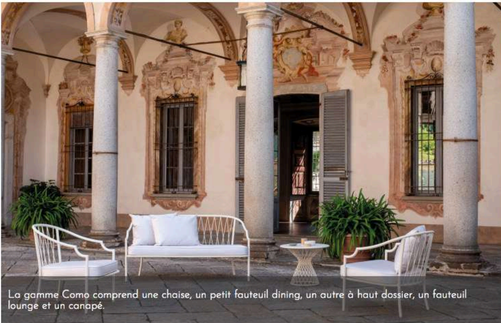
La gamme Como comprend une chaise, un petit fauteuil dining, un autre à haut dossier, un fauteuil lounge et un canapé.