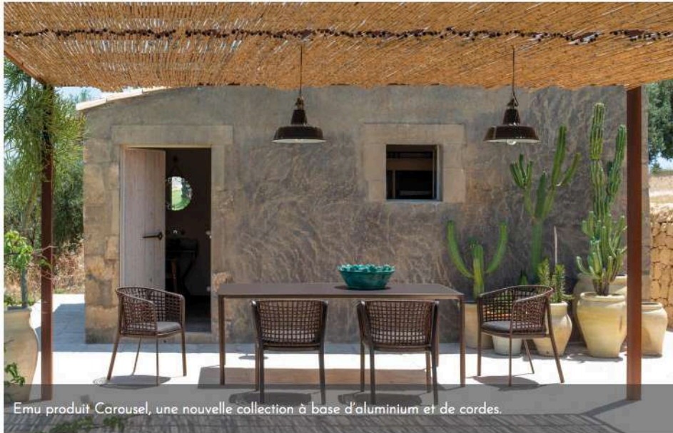
Emu produit Carousel, une nouvelle collection à base d'aluminium et de cordes.