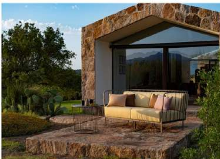
Canapé Cannolè , design Emanuel Gargano et Anton Cristell (Emu).

Avec l'arrivée des beaux jours, le désir de (re)décorer son extérieur se fait sentir. Chaises, fauteuils, canapés... voici 10 modèles qui nous ont tapé dans l'œil.