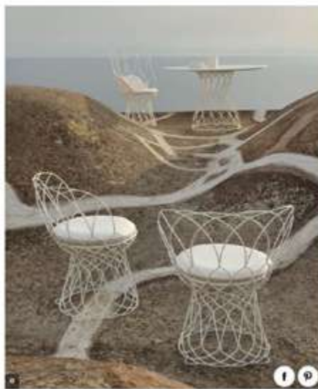
Fauteuil "Re-trouvé" Large en acier, design Patricia Urquiola, 718 euros, Emu sur Madelindesign.com