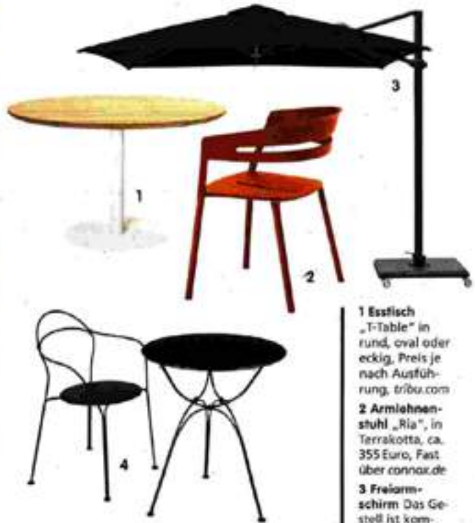
1 Esstisch „T-Table“ in rund, oval oder eckig, Preis je nach Ausführung, tribu.com 2 Armlehnstuhl „Ria“, in Terrakotta, ca. 355 Euro, Fast über connax.de 3 Freiarmschirm Das Gestell ist komplett schwarz pulverbeschichtet, ab ca. 1770 Euro, weishaepf.de