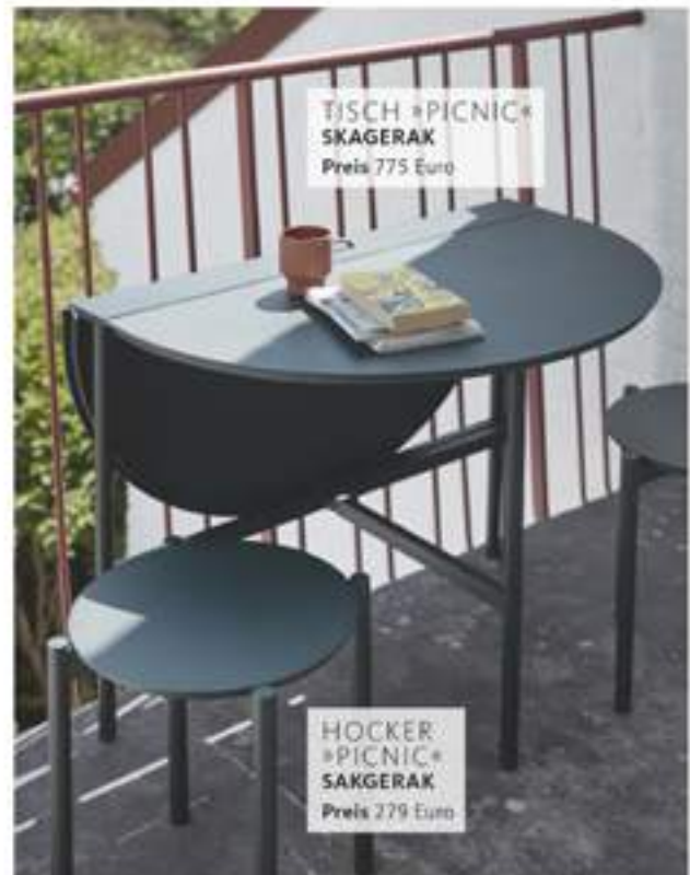
TISCH »PICNIC« SKAGERAK Preis 775 Euro