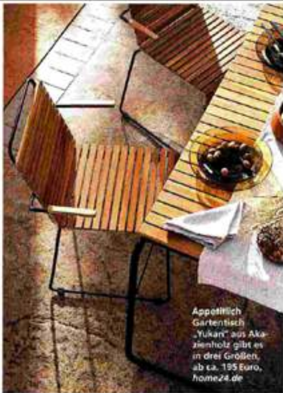
Appetitlich Gartentisch „Yukan“ aus Akazienholz gibt es in drei Größen, ab ca. 195 Euro, home24.de