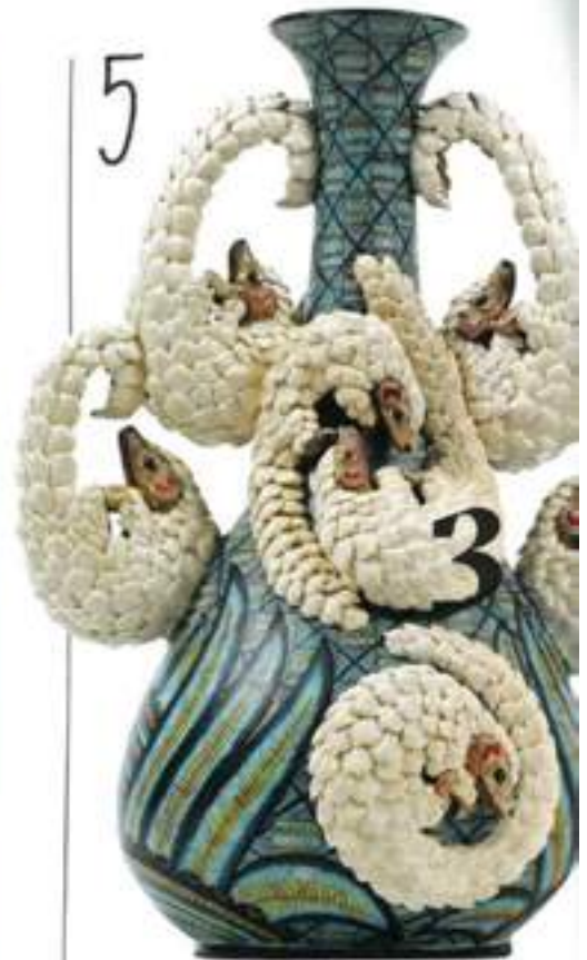
5 Schuppentier-Parade: Thabiso Mohlakoana formte die „Pangolin Vase“ (als Duo 6500 Euro), die Koloristin Jabu Nene verlieh ihr Zulumuster ardmore-design.com 6 Stauraum-Geometrie: Nussbaumschrank mit Messingmarketerie, 170 cm hoch medium.it 7 Sitz-Familie: Emus Outdoorkollektion „Cannolè“ gibt es in diversen Farbkombis. Zweisitzer ab 2750 Euro emu.it