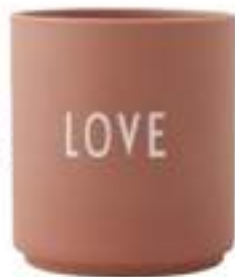
BECHER »FAVOURITE« DESIGN LETTERS Preis 20 Euro