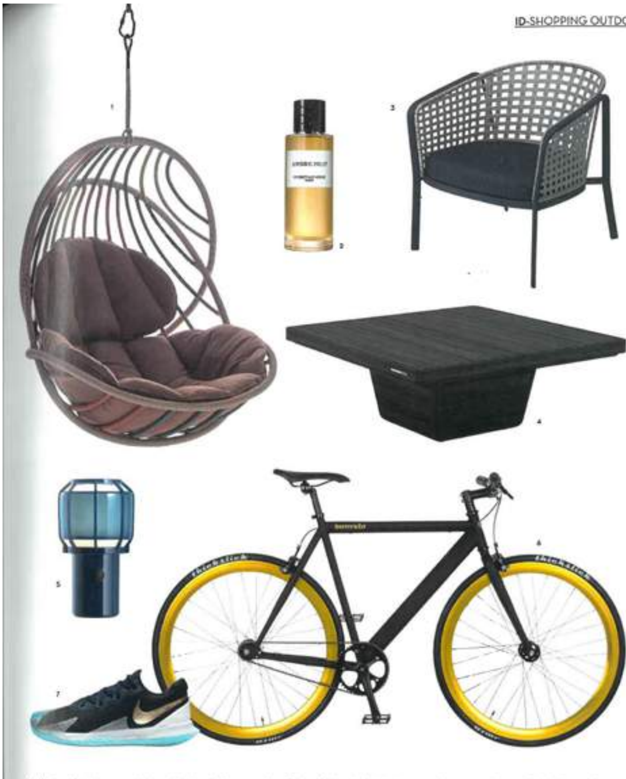
1/ Komfortabler Hängesessel Kido von Stephen Burks, ca. 3395 Euro. Dedon. 2/ Unisexduft Amber N°1 mit Ambernote, 125 ml ca. 220 Euro. Christian Dior. 3/ Lougestuhl Carousel mit effektivem Geflecht von Sebastian Herkner, ca. 820 Euro. Emu. 4/ Minimalistischer Coffee-Table Cobi aus lackierten Teakholzpaneelen, ca. 1570 Euro. Marutti. 5/ Die Outdoorleuchte Chippo dient dank der mitgelieferten Aufhängung auch als Pendelleuchte, ca. 150 Euro. Maserati. 6/ Fahrrad Blu mit Stahlrahmen und rustikalen Details, ca. 390 Euro. Bonvelo. 7/ Tennisschuhe Air Zoom Vapor Speed 4, ca. 125 Euro. Nike