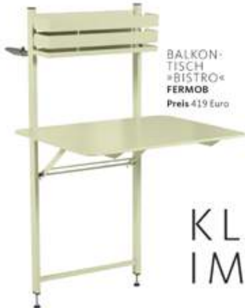
BALKON- TISCH »BISTRO« FERMOB Preis 419 Euro