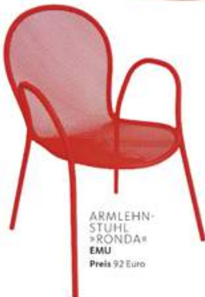
ARMLEHN- STUHL »RONDA« EMU Preis 92 Euro