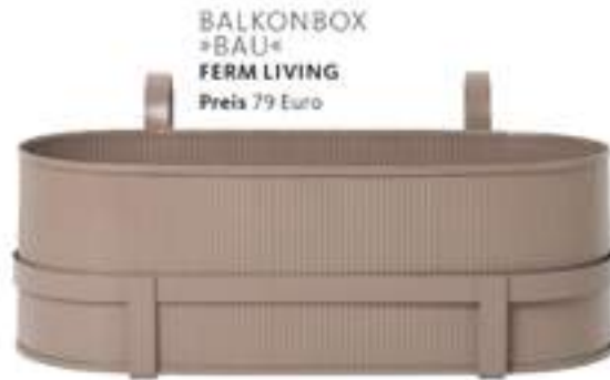
BALKONBOX »BAU« FERM LIVING Preis 79 Euro