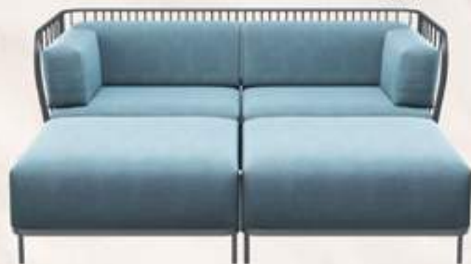
No Blues Die neue Sommerkollektion des italienischen Labels Enza betitelt durch schlichte Sprössen und poppige Bezüge. enza.it

Foto: A.O. Illustration: Inklusiv! by LUCIANO Design: Jannis Bennis, Courtesy of B&B Italia, Courtesy of Odeon, Courtesy of Kikka, Courtesy of Proulx, Courtesy of Bert Plantagie, Courtesy of Enza, Courtesy of B&B Italia, Courtesy of Odeon