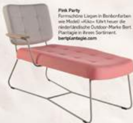
Pink Party Formschöne Liegen in Bomborfarben wie Modell »Kiko« führt neuer die niederländische Outdoor-Marke Bert Plantagie in ihrem Sortiment. bertplantagie.com

Relax-Modus. Teil zwei! Nach leuchtendem Weiß treiben wir es nun bunt im Garten und am Beach. Die Daybeds haben nicht umsonst den Status uneingeschränkter Gemütlichkeit erlangt. Wollen auch Sie in eine dieser Wohlfühloasen sinken?