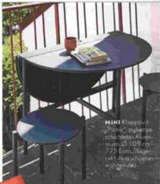
MINI Klapptisch „Picnic“, pulverbeschichtetes Aluminium, Ø 105 cm, 775 Euro, Skagerrak (shop.schoenerwohnen.de)