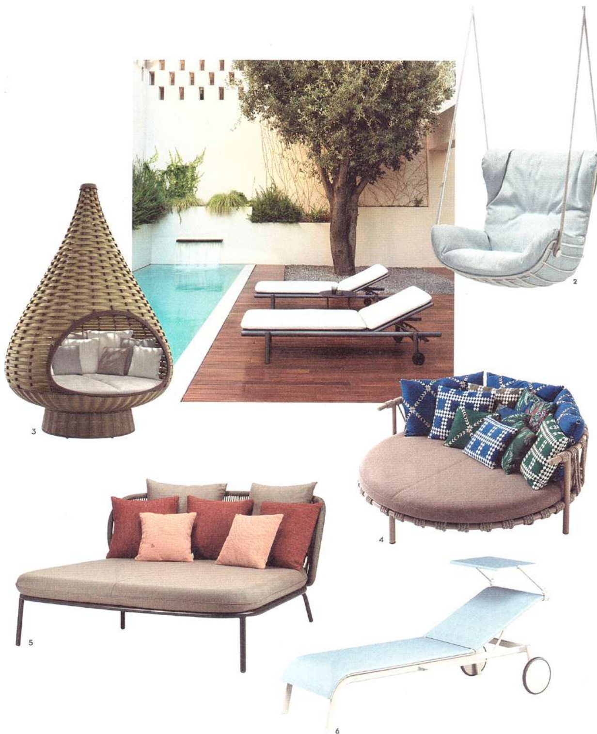
1/ Sonnenliege Up mit Rädern und Sunbrella-Mesh-Gewebe, 926 Euro, Expormim. 2/ Schwingessel Leyasol Wingback aus Stahl mit wetterfesten Kunst-daunenkissen, ca. 2200 Euro, Freifrau. 3/ Drehbares Sommerrefugium Nestrest Standing Lounger aus Dedon-Faser, ca. 11700 Euro, Dedon. 4/ Lounge-Insel Trampoline von Patricia Urquiola aus Edelstahl und Nylonkordel, ca. 7200 Euro, inklusive dreier Kissen, Cassina. 5/ Breites Daybed Kodo aus Polypropylenseil und Aluminium, ca. 2290 Euro, Vincent Sheppard. 6/ Stapelbare Liege Tiki mit Sonnenblende aus Aluminium und Emu-TEX, Preis auf Anfrage, Emu.