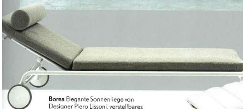
Borea Elegante Sonnenliege von Designer Piero Lissoni, verstellbares Kopfteil, 91,5 x 214 x 35,5 cm, Preis auf Anfrage (bebitalia.com)