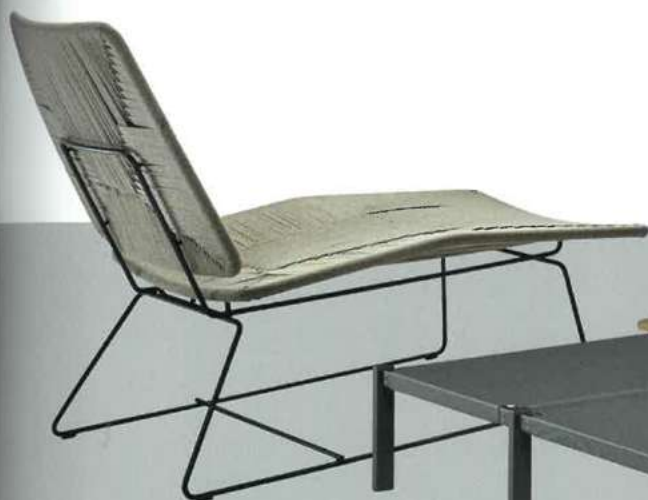
Echoes Chaiselongue , Stahlgestell in verschiedenen Farben, Geflecht aus Papier- oder Seegraskordel, 65 x 140 x 91 cm, ca. 2800 Euro (flexform.it)