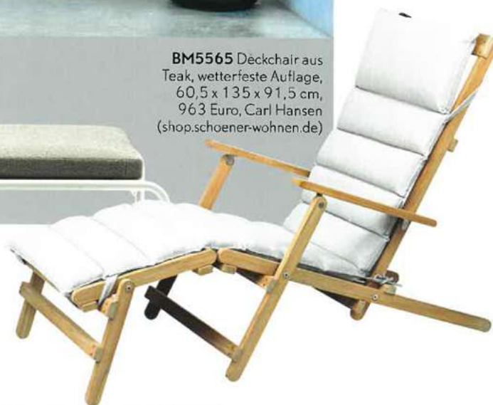
BM5565 Deckchair aus Teak, wetterfeste Auflage, 60,5 x 135 x 91,5 cm, 963 Euro, Carl Hansen (shop.schoener-wohnen.de)