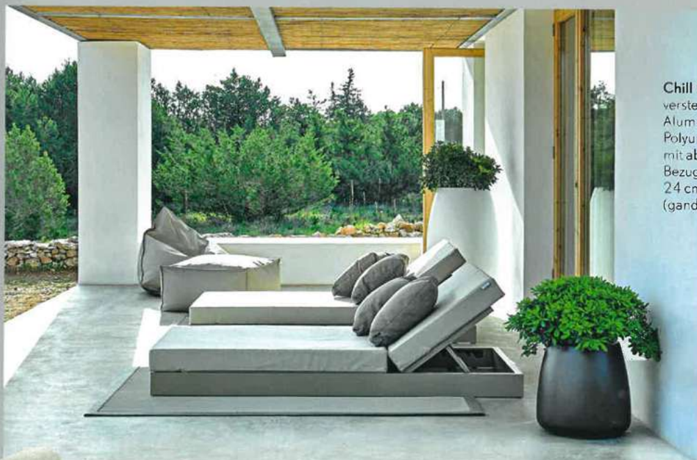
Chill Daybed mit verstellbarem Kopfteil, Aluminiumgestell, Polyurethan-Polster mit abziehbarem Bezug, 100 x 200 x 24 cm, ca. 2000 Euro (gandiablasco.com)