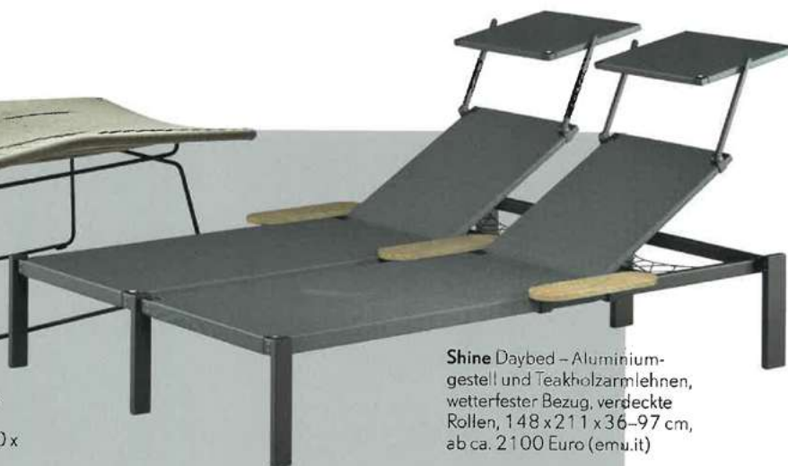
Shine Daybed – Aluminiumgestell und Teakholzarmlehnen, wetterfester Bezug, verdeckte Rollen, 148 x 211 x 36–97 cm, ab ca. 2100 Euro (emu.it)