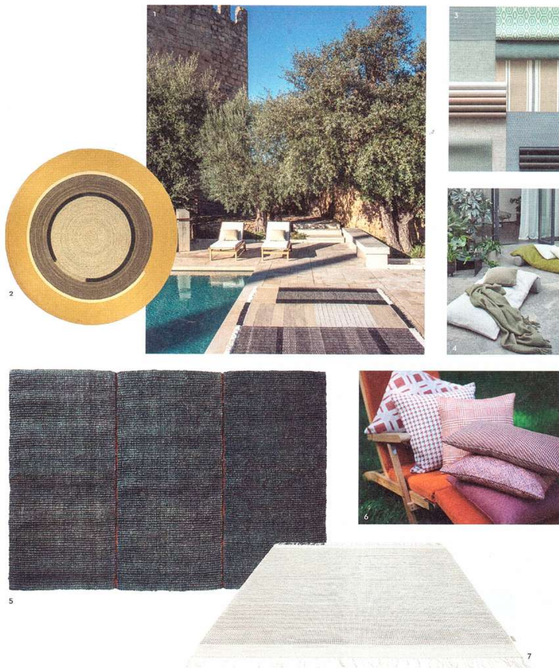
1/ Großer Teppich Tres Outdoor Black aus geschmeidigem PET, ab ca. 1600 Euro. Nanimarquina. 2/ Runder Teppich Disco aus PET mit rückseitiger Latexbeschichtung, ca. 2200 Euro. Élitis. 3/ Bezugstoffe Caprera in Meerestönen aus der Kollektion Terramare , P. a. Anfr. Emu 4/ Wasserfester Möbelstoff Outdoor Sneaker , P. a. Anfr., Création Baumann. 5/ Rustikaler Coconutrug aus Kokosnusssfaser, P. a. Anfr., G.T. Design. 6/ UV-resistente Jacquard-Kollektion Argentario aus Polypropylen, P. a. Anfr. Christian Fischbacher. 7/ Teppich Twist mit Fransen aus wetterfestem Textilene, ab ca. 2560 Euro. Manutti.