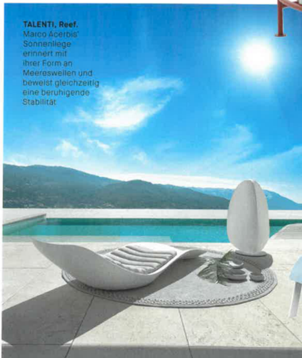
TALENTI, Reef. Marco Acerbis' Sonnenliege erinnert mit ihrer Form an Meereswellen und beweist gleichzeitig eine beruhigende Stabilität