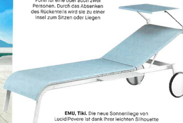
EMU, Tiki. Die neue Sonnenliege von LucidiPevere ist dank ihrer leichten Silhouette von schlichter Schönheit. Der wechselbare Stoff kommt auch beim integrierten Sonnenschutz zum Einsatz