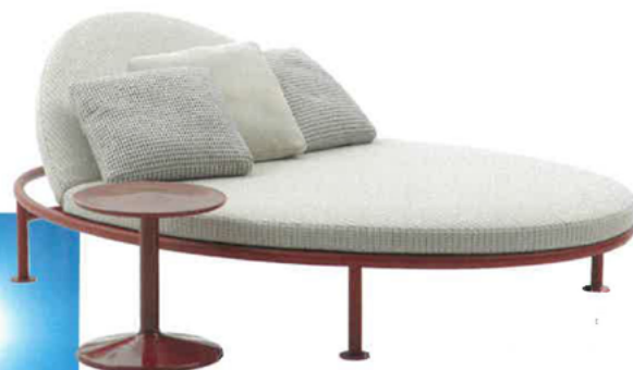
B&B ITALIA, Borea Sunbed Lounge. Die Chaiselongue von Piero Lissoni hat eine einladende Form für eine oder auch zwei Personen. Durch das Absenken des Rückenteils wird sie zu einer Insel zum Sitzen oder Liegen