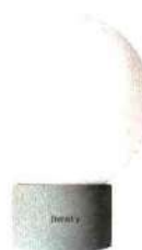
Leuchtkugel Die mobile LED-Tischleuchte „Terra“ ist dimmbar, mit Touchfunktion, H 25 cm, ca. 80 Euro, LumiSky über westwingnow.de