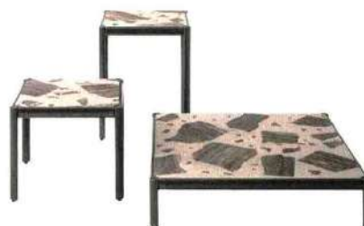
Stilvoller Bruch Tischserie „Aldia“ mit Gestellen aus zinnlackiertem Metall und einer Platte aus Fragmenten von Nussbaum-Travertin und Marmor, Preis je nach Ausführung, giorgettimeda.com