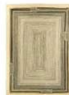
Outdoor-Teppich „Disco“ von Élitis, um 2200 €