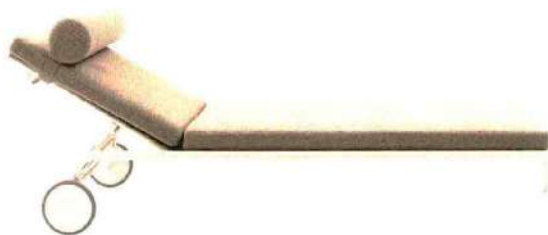
In Nude Liege „Borea“ von Designer Pierro Lissoni wirkt durch ihr helles Aluminiumgestell federleicht, in zwei Farben erhältlich, ab ca. 2080 Euro, bebitalia.com