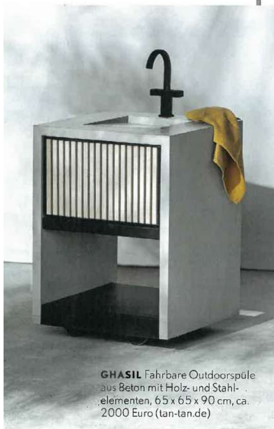
GHASIL Fahrbare Outdoorspüle aus Beton mit Holz- und Stahlelementen, 65 x 65 x 90 cm, ca. 2000 Euro (tan-tan.de)

Leichte Kost, leichte Möbel – denn wer will bei 30 Grad im Schatten schon Schwergewichte schleppen? Niemand. Outdoorküchen stehen auf Rollen, schlanke, oftmals stapelbare Stühle ergänzen die Tafel. Das Gute daran: Sie sind oft so bequem, dass sie ohne Weiteres auch drinnen am Esstisch stehen können