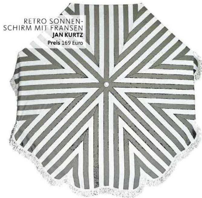
RETRO SONNEN- SCHIRM MIT FRANSEN JAN KURTZ Preis 169 Euro