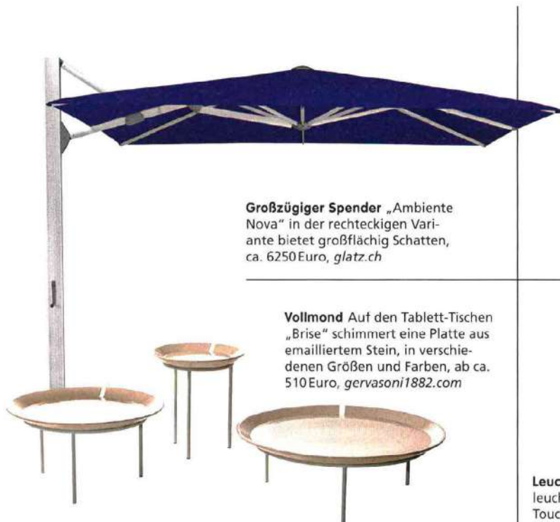
Großzügiger Spender „Ambiente Nova“ in der rechteckigen Variante bietet großflächig Schatten, ca. 6250 Euro, glatz.ch