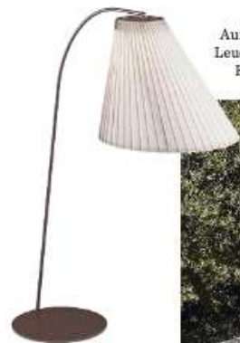
Aufladbare Outdoor-Leuchte „Cone XL“ von Emu, um 3530 €