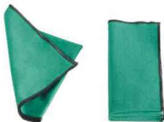
SERVIETTE 4ER SET »OUTLINE« HAY Preis 35 Euro