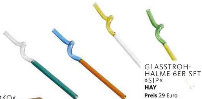
GLASSTROH- HALME 6ER SET »SIP« HAY Preis 29 Euro