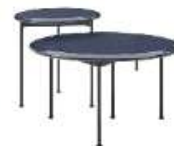
Beistelltische „Borea“ von B&B Italia, ab 1030 €