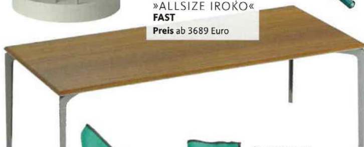
TISCH »ALLSIZE IROKO« FAST Preis ab 3689 Euro