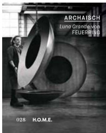
ARCHAISCH Luna Grande von FEUERRING