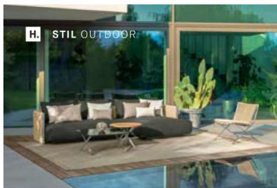
H. STIL OUTDOOR