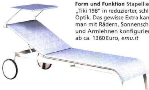
Form und Funktion Stapelliege „Tiki 198“ in reduzierter, schlanker Optik. Das gewisse Extra kann man mit Rädern, Sonnenschutz und Armlehnen konfigurieren, ab ca. 1360 Euro, emu.it

Einfach mal langmachen: Die klassische Gartenliege gibt es in diesem Jahr in zahlreichen Neuauflagen. Ob in Holz oder pulverbeschichtetem Aluminium – dieses Möbel macht einfach immer eine gute Figur.