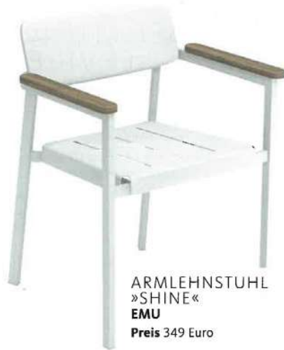
ARMLEHNSTUHL »SHINE« EMU Preis 349 Euro