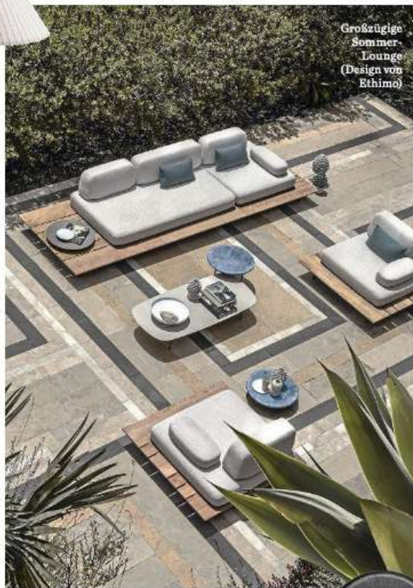
Großzügige Sommer-Lounge (Design von Ethimo)