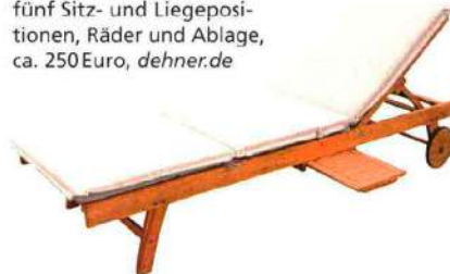
Archetyp „Ravenna“ hat alles, was eine klassische Gartenliege ausmacht: fünf Sitz- und Liegepositionen, Räder und Ablage, ca. 250 Euro, dehner.de