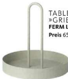
TABLETT »GRIB« FERM LIVING Preis 65 Euro