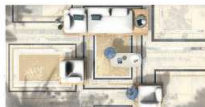
Ein Wohnzimmer ohne Wände, dafür mit ganz viel (Sonnen-)Licht!