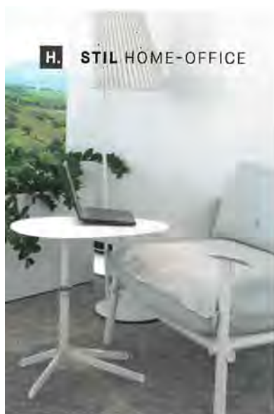
H. STIL HOME-OFFICE