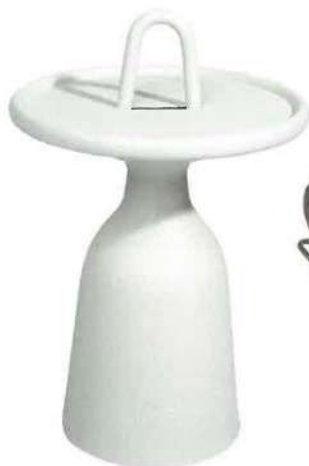
BEISTELLTISCH »104« MINDO Preis 329 Euro