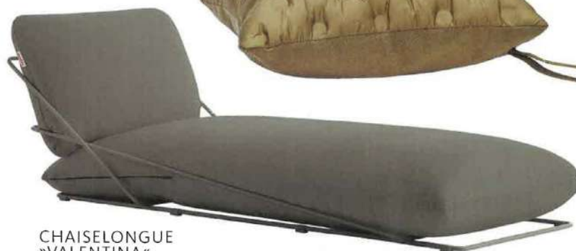
CHAISELONGUE »VALENTINA« DIABLA Preis 1190 Euro