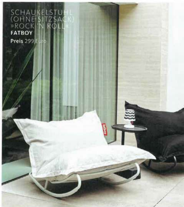
SCHAUKELSTUHL (OHNE SITZSACK) »ROCK 'N ROLL« FATBOY Preis 299 Euro