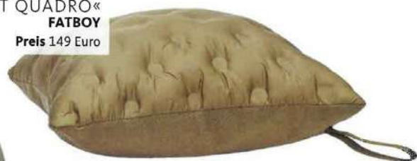
KISSEN MIT WÄRMEFUNKTION »HOTSPOT QUADRO« FATBOY Preis 149 Euro