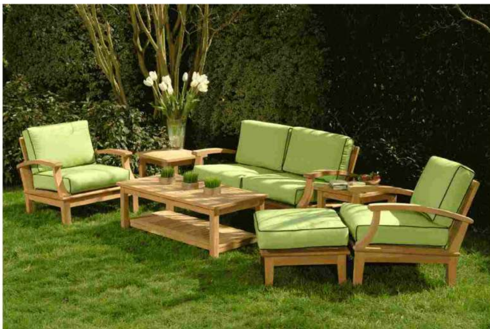
ARREDAMENTO DA GIARDINI ECCO CHI SONO I LEADER IN ITALIA

Nata nel 1946 come azienda dedicata alla produzione di articoli legno, nel corso degli anni Foppapedretti si sviluppa sempre più, incentrando la propria attività sui mobili di arredamento per esterni ed interni. Oggi, l'azienda offre moltissimi prodotti da giardino, realizzati con la massima qualità e professionalità del mestiere per un risultato assolutamente impeccabile.