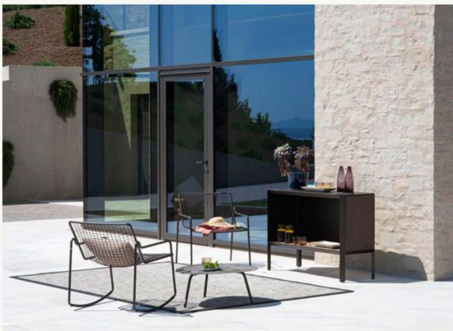
Camaleon, design Andreucci & Hoisl, è un sistema modulare multifunzionale e personalizzabile

Reel , design Pio e Tito Toso, è un “divano a dondolo” che si trasforma in un Daybed in quanto il suo schienale può essere facilmente regolato in base all'esigenza. Il parasole inclinabile e regolabile, permette alla luce di filtrare in maniera naturale e dosata, assicurando massimo relax.