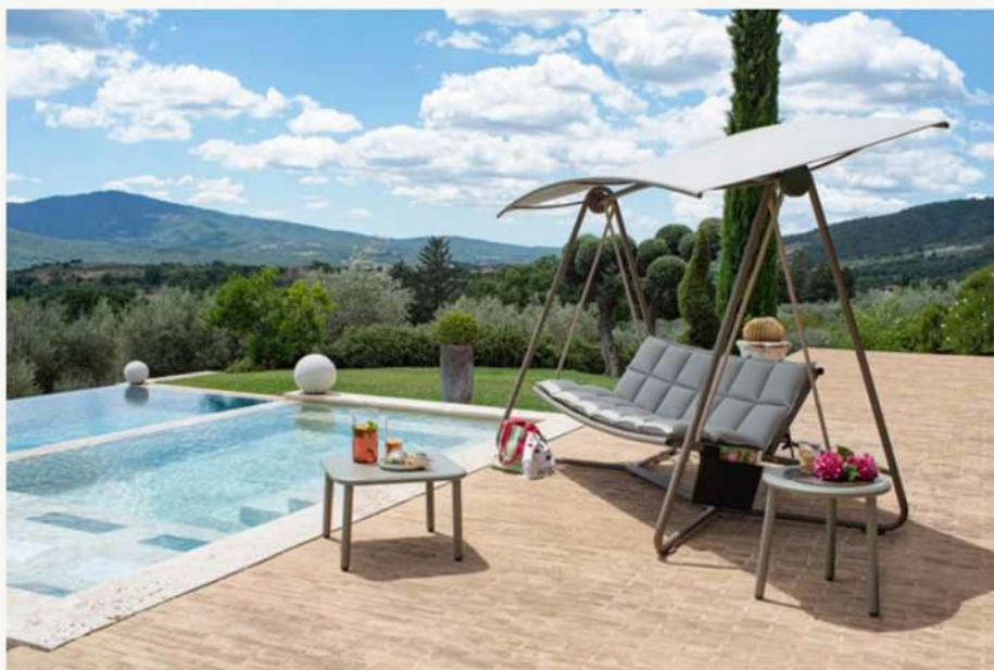
Reel, design Pio e Tito Toso, divano a dondolo che si trasforma in un Daybed con parasole inclinabile e regolabile

Reel , design Pio e Tito Toso, è un “divano a dondolo” che si trasforma in un Daybed in quanto il suo schienale può essere facilmente regolato in base all'esigenza. Il parasole inclinabile e regolabile, permette alla luce di filtrare in maniera naturale e dosata, assicurando massimo relax.