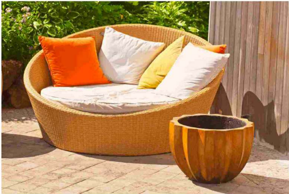
ARREDAMENTO DA GIARDINI ECCO CHI SONO I LEADER IN ITALIA