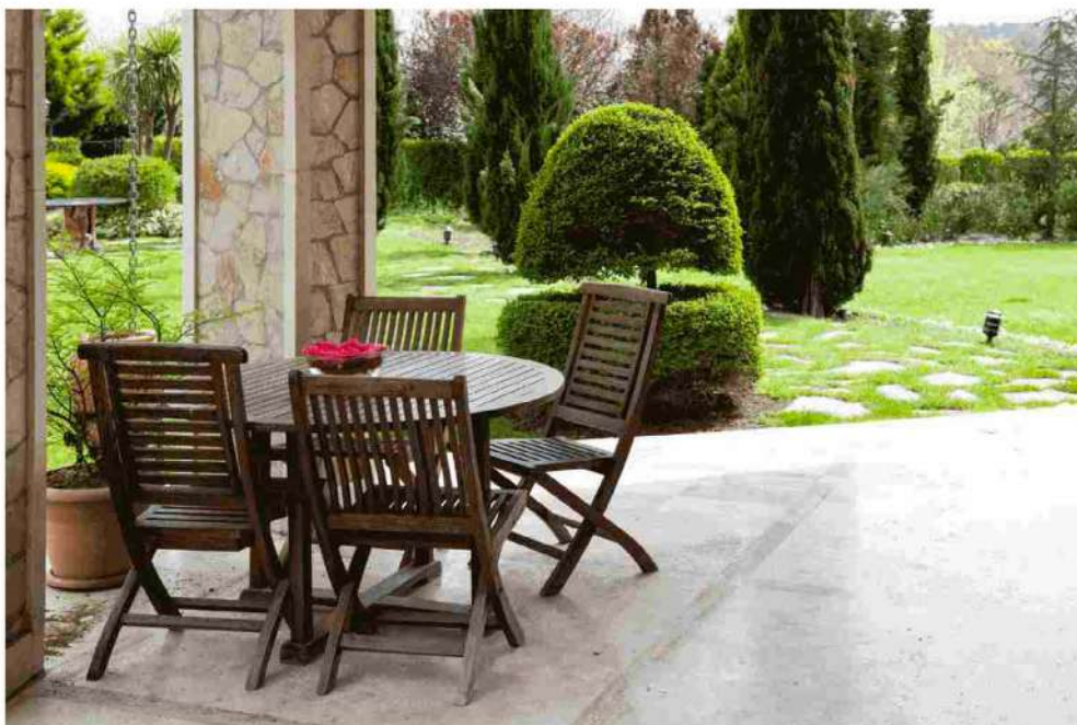
ARREDAMENTO DA GIARDINI ECCO CHI SONO I LEADER IN ITALIA

Talenti è uno tra i brand più prestigiosi per l'outdoor firmato Made in Italy. L'azienda, nata nel 2005, è presente oggi nel mercato globale, presentando una realtà dell'arredamento da esterni moderna, funzionale ed elegante. Sul catalogo dell'azienda sono disponibili moltissimi prodotti, ideali per arricchire e abbellire il proprio giardino al meglio.