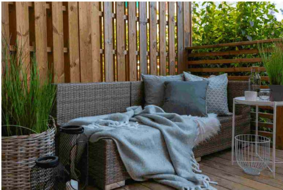
ARREDAMENTO DA GIARDINI ECCO CHI SONO I LEADER IN ITALIA

Nata a Brescia nel 2016, l'azienda Zenucchi è specializzata nella produzione di articoli per l'arredamento outdoor. L'obiettivo principale dell'azienda è quello di garantire ai clienti una massima qualità della propria vita tramite, a sua volta, una massima qualità dei prodotti presentati. Nello specifico, Zenucchi presenta un'intera sezione dedicata all'outdoor, tra complementi d'arredo, divani, vasi, poltrone, pouf, lettini, tavoli e così via.