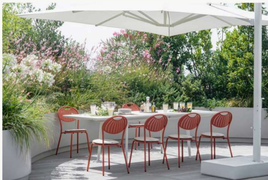
Coupole, arredi per esterno EMU

Coupole è composta da sedia e sgabello in acciaio ed è una reinterpretazione in chiave contemporanea, dell'omonimo e storico best seller, affidata al Centro Ricerca e Sviluppo di EMU. Il singolare motivo del suo schienale si ispira alle forme della Cupola del Brunelleschi.