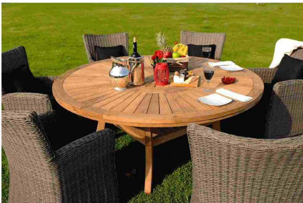
ARREDAMENTO DA GIARDINI ECCO CHI SONO I LEADER IN ITALIA