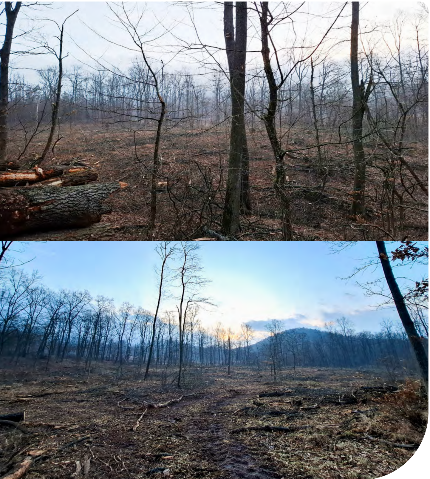
| 3. ábra: Végvágott terület a Börzsönyben, Natura 2000 terület, Bezina-völgy, 2025. január.

A vágásos erdőgazdálkodás hozzájárul ahhoz, hogy az időjárás egyre szélsőségesebb legyen, és ezáltal is egyre gyakoribbak lesznek a súlyos aszályos hónapok, valamint egyre gyakrabban fordulnak majd elő özvízszerű esők, melyek elmosják a termőtalajt és a településeket.