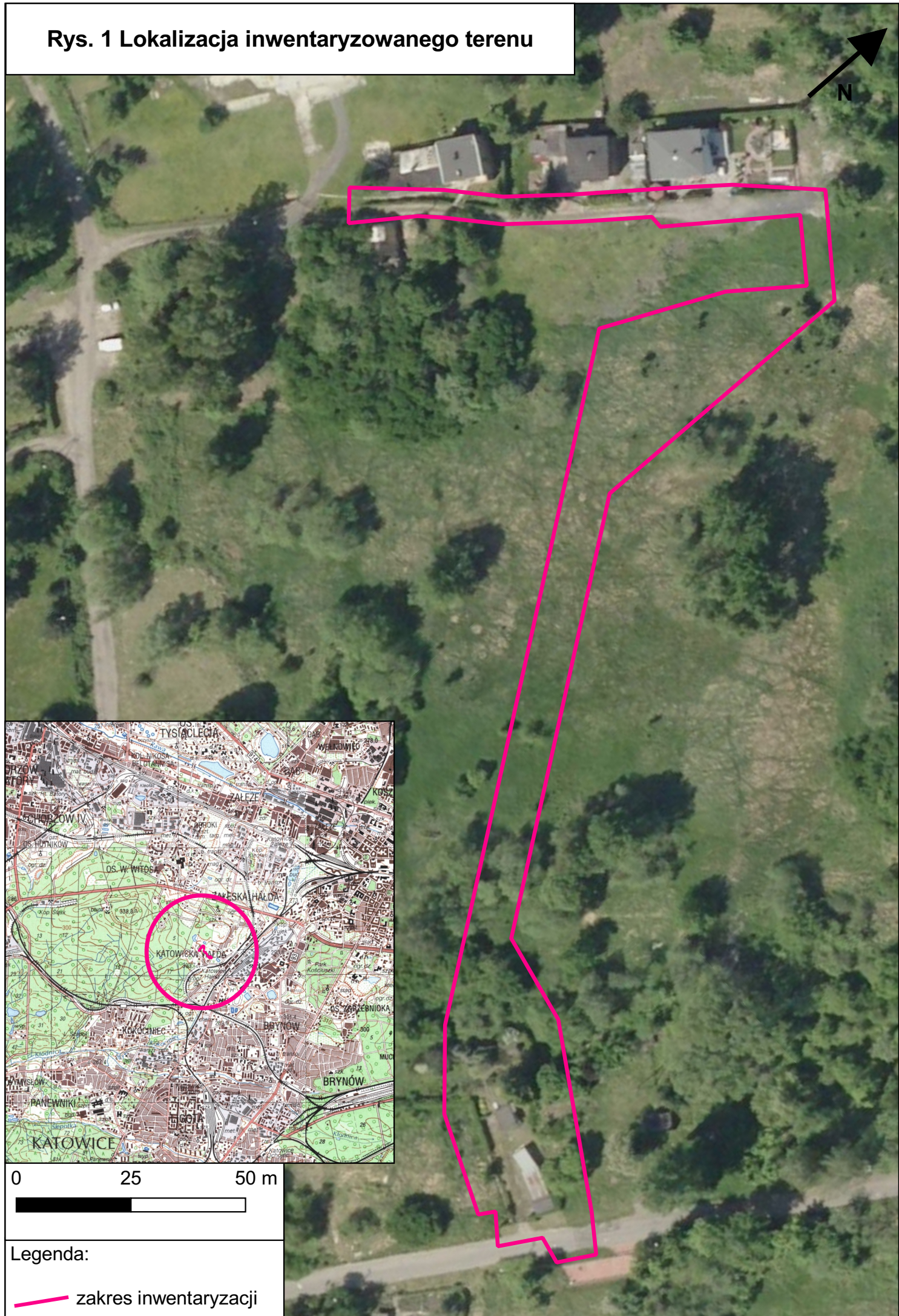
Rys. 1 Lokalizacja inwentaryzowanego terenu