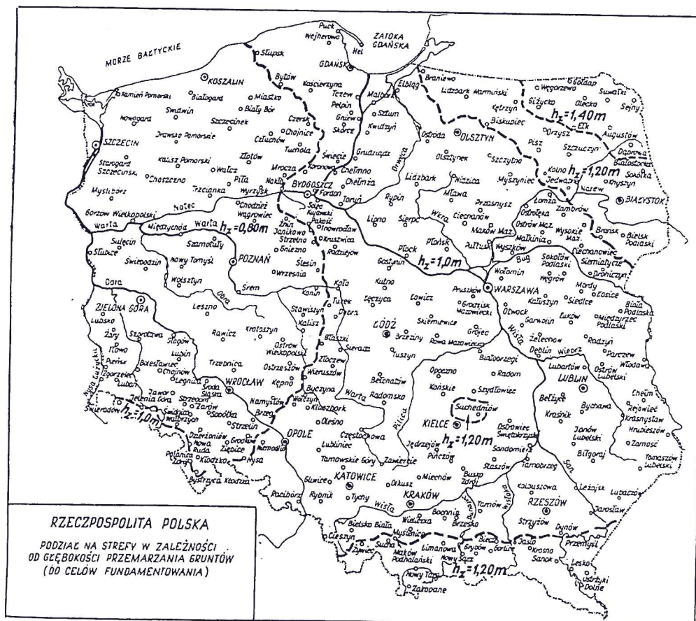
Rys. 1. Podział kraju na strefy w zależności od głębokości przemarzania gruntu (wg PN-81/B-03020)

5.3.6 Przewody sieci kanalizacyjnej na mostach, jeśli nie służą do odwodnienia jezdni i chodników, powinny być umieszczone w stalowych rurach ochronnych, zgodnie z wymogami rozporządzenia [4].