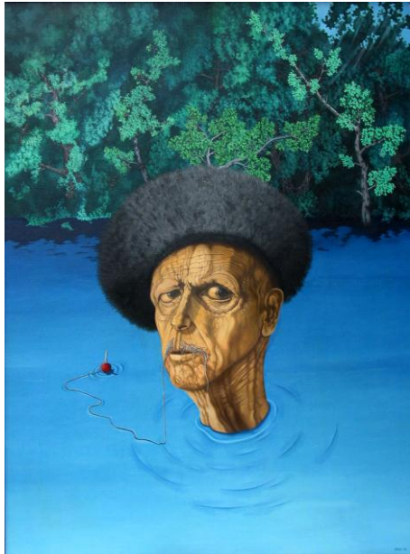
Rudolf PLAČEK: Sen o Neizvjestném, 1976, olej na plátně

Pro velký úspěch je prodloužena až do 17. května 2010 výstava grafik Jiřího Jiráska.