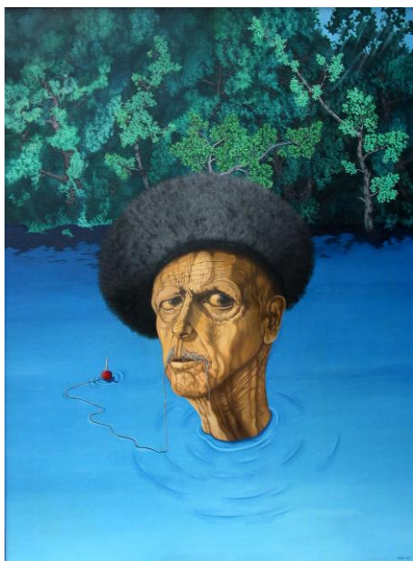
Rudolf Plaček: Sen o Neizvěstném, 1976, olej na plátně