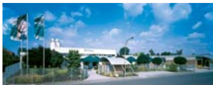
Silikal, Produktion und Verwaltung in Mainhausen, Frankfurt am Main