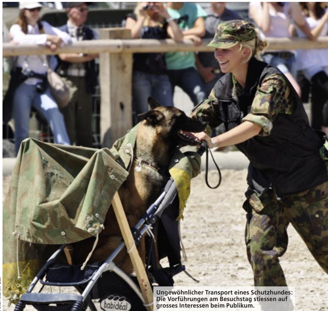
Ungewöhnlicher Transport eines Schutzhundes: Die Vorführungen am Besuchstag stiessen auf grosses Interesse beim Publikum.

Apropos Ausbildung: «Geplant ist, die Ausbildung zum Lawinenhund wieder vermehrt zu fördern und auch Spezialitäten wie Minensuchhunde oder spezialisierte Spürhunde zu erwägen. Aber das ist noch Zukunftsmusik. Vorerst kümmern wir uns darum, dass es mit den vorhandenen Aus-