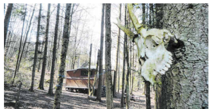
Kein Dorf der Apachen und auch kein Hort der Finsternis wird von diesem Tiereschädel bewacht – die knöchernen Trophäe wacht über den Eingang zum Waldkindergarten von Michelbach an der Bilz.