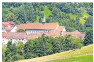
Das Kloster Gnadental prägt das Ortsbild.

Michelfeld. Das für diesen Sonntag geplante Saison-Opening auf dem Kulturlandschaftspfad Gnadental kann infolge der Corona-Pandemie auch dieses Jahr nicht stattfinden. Dies berichtet