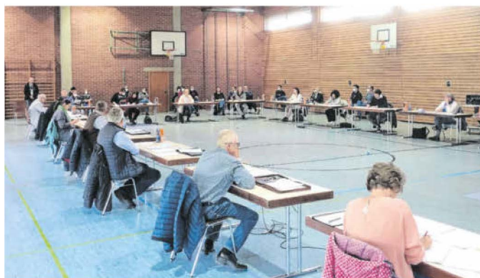
Rund 20 Bürger verfolgen am Montag die Gemeinderatssitzung in der Steinackerhalle. Einige melden sich zu Wort.