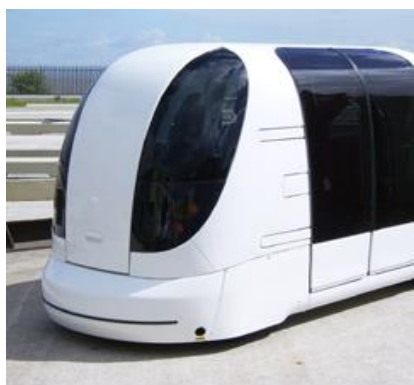
ULTra , véhicule collectif du futur ...