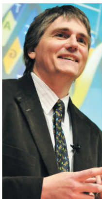
ЮРІЙ МОНЧАК, професор медичного факультету Макгілльського та Монреальського університетів (Канада)

Наша програма творить новий спосіб думання та нову ментальність, у якій цінність та гідність людського життя є шанованою від зачаття аж до природної смерті. Через різні курси на тему християнської моралі та біоетики, живе спілкування між учасниками та викладачами Школи, ми творимо платформу, на якій разом працюють лікарі, богослови, юристи, медичні капелани, біологи, біоетики. Це дає змогу плекати і розвивати в Україні нову культуру – «культуру життя», якої сьогодні так потребує наше суспільство.