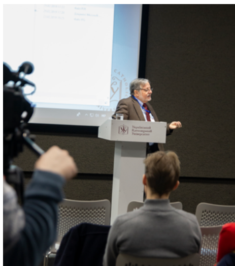
Вечірня дискусія: “Глобальні комунікації, міжрелігійний діалог та дружба”

- Тому що є два види секуляризму - ідеологічний секуляризм, який є теорією історії, згідно з якою людство а priori має здійснити революцію чи стрибок від релігійних вірувань та релігійної свідомості до ідеалу модерного раціоналізму. Цей ідеологічний підхід є емпірично та нормативно неправильним і сумнівним. З іншого боку, політичний секуляризм робить спробу на державному рівні секуляризувати суспільство.