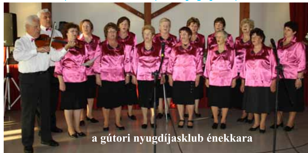
a gútori nyugdíjasklub énekara

dôchodcovia, deti od 16 rokov 3,00 € nyugdíjasok, diákok 16 évtől