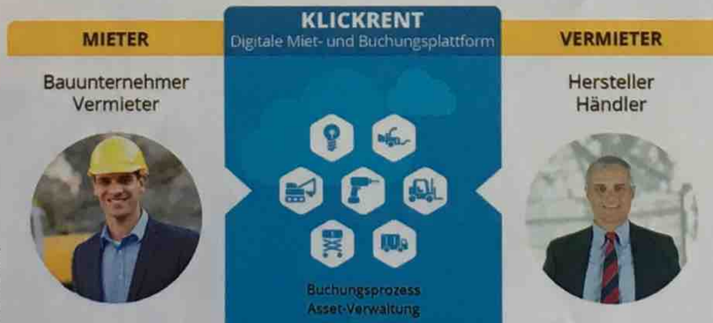
Bild 2 klickrent führt Mieter und Vermieter online zusammen

Das Mietgeschäft, das seit Jahrzehnten über Telefon, E-Mail und Fax abläuft, wird dank der Plattform für alle Beteiligten einfacher und profitabler. Der gesamte offline Mietprozess von der Auswahl der Maschine und des Mietpartners, der Preisfindung bis hin zum Transport werden auf der digitalen Plattform abgebildet. Mit Hilfe einer Postleitzahl-genauen Suchfunktion können Mieter verfügbare Maschinen in ganz Deutschland für ihren individuellen Einsatzort finden. Von jeder Maschine werden neben der Verfügbarkeit in Echtzeit auch verbindliche Preise angezeigt. Der Transport kann je Produkt separat dazu gebucht werden, ebenso die Versicherung. Eine verbindliche und für beide