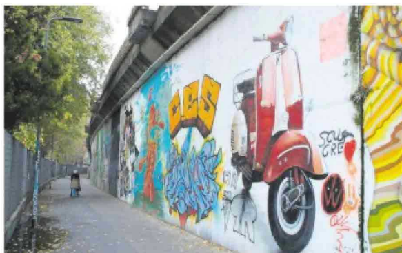
NORTH OF LORETO L'area «a nord di Loreto», NoLo appunto, è diventata negli ultimi due anni il quartiere dei creativi, un rilancio nato quasi con il passaparola